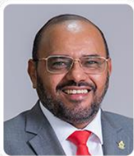
EVERTON ASSIS UNIÃO BRASIL